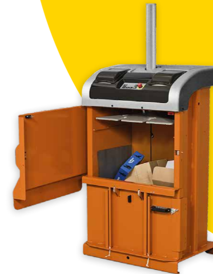
Orwak Compact-Serie: Ballen zu 50–100 kg Zyklus 13–33 Sekunden Presskraft 4–12 Tonnen