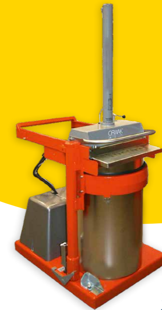
Orwak Flex-Serie: Ballen zu 40–80 kg Zyklus 29–36 Sekunden Presskraft 1,5–3 Tonnen