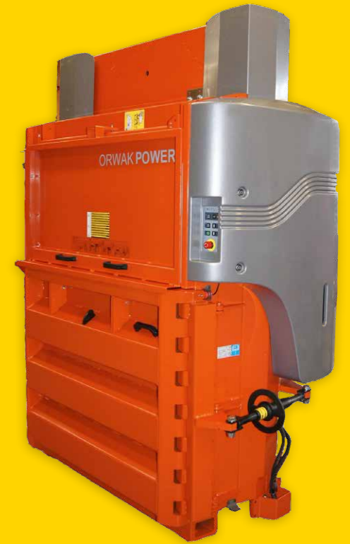
Orwak Power-Serie: Ballen zu 200–500 kg Zyklus 24–46 Sekunden Presskraft 18,5–52 Tonnen