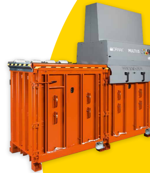
Orwak Multi-Serie: Ballen zu 50–200 kg Zyklus 20–36 Sekunden Presskraft 3–20 Tonnen